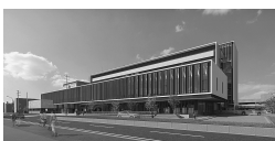
新庁舎北側外観 イメージ図

答 請負業者は閣議決定等されている 働き方改革の中で、4週8休体制の遵 守を模範的に示したいと言っている。 話し合いの中で、工程に影響はないか という確認を行い、現在5日間の日程 の遅れは、全体の中で何とか吸収して いくという回答を得ている。何らかの 突発的な事故、事案等がない限り対応 できると考えている。